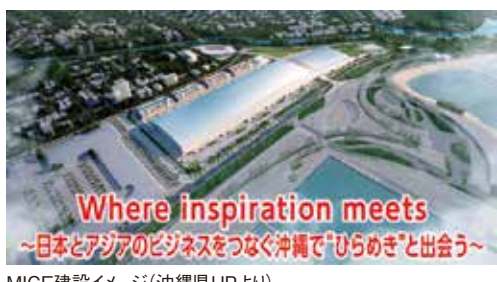
MICE建設イメージ

県は多くの人が沖縄の地を訪れることで経済を活性化させるよう、その中心となるMICE施設をつくる計画をしています。しかし、以前の計画案は採算が取れる見込みがないことから、国からの予算がおりませんでした。