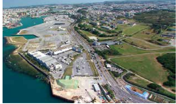
那覇軍港

那覇軍港移設問題について自民党県議団は一体となつて取り組みました。非常に複雑な問題です。で、これまでの主な出来事を整理しました。