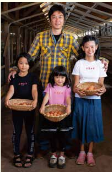
家族でみんぱってます。(糸満市)