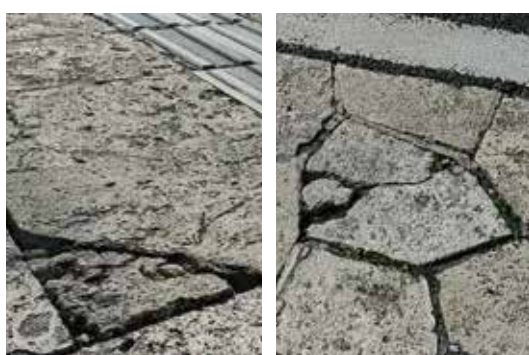
割れた敷石の現状